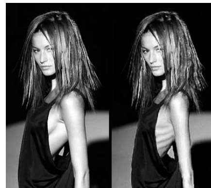
»Thinspirations« aus dem Internet vor und nach der Bildbearbeitung